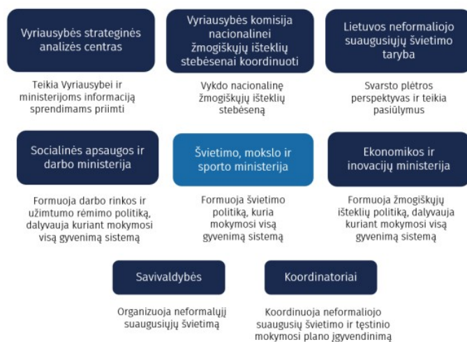
1 pav. Mokymosi visą gyvenimą sistemos dalyviai 1

Mokymosi visą gyvenimą sistema yra kompleksinė, jos įgyvendinime dalyvauja skirtingos valstybinės institucijos. Sistemos dalyviai vaizduojami 1 pav. žemiau.