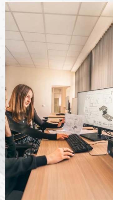
Kompiuterinio projektavimo operatorius